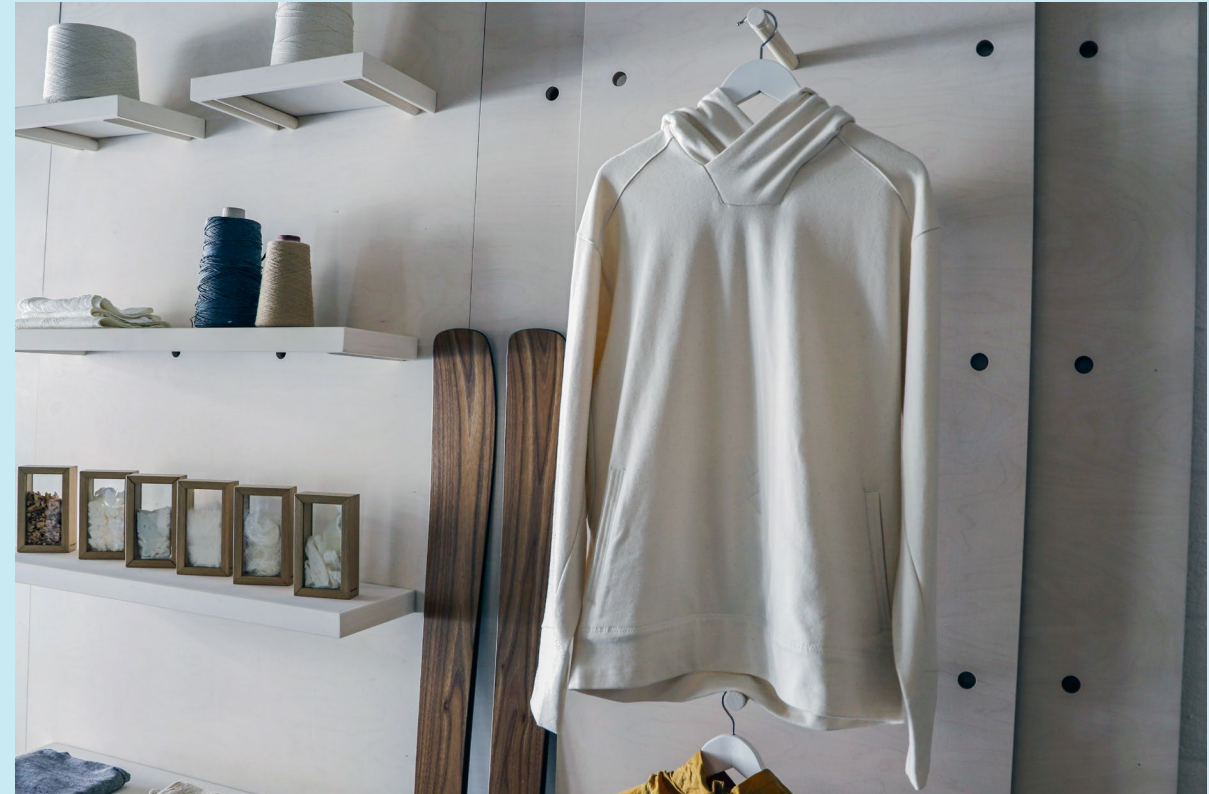
Spinnova Oyj, Jyväskylä