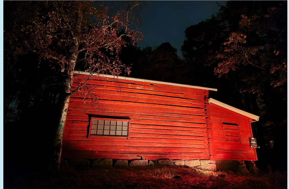
Taavettilan riihi, Jyväskylä

Tässä luvussa on tarkasteltu maakuntavaltuuston talousarviossa sekä talous- ja toimintasuunnitelmassa asettamien tavoitteiden toteutumista. Päättäneen tilikauden toteumatiedot ja tunnusluvut on esitelty Keski-Suomen liiton tilinpäätöksessä ja toimintakertomuksessa vuodelta 2025.